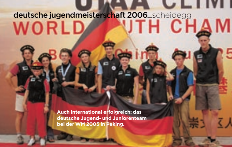
Auch international erfolgreich: das deutsche Jugend- und Juniorenteam bei der WM 2005 in Peking.